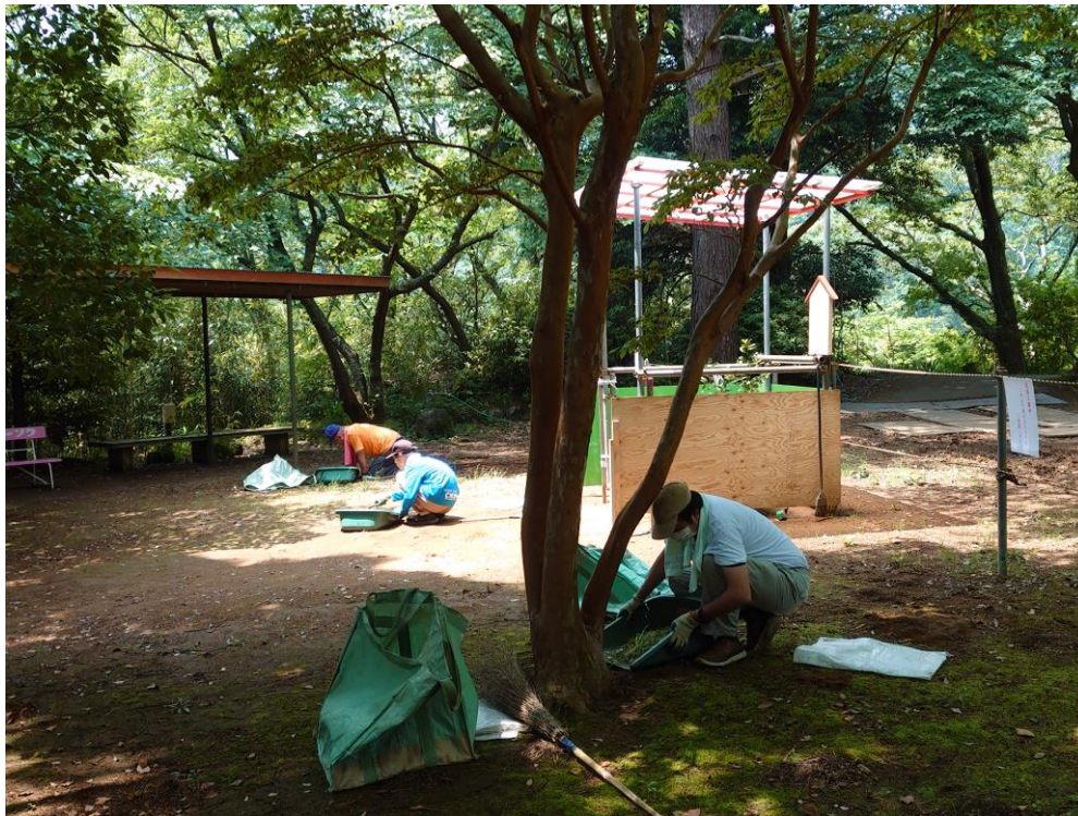
伊豆山神社 本宮にて草取り